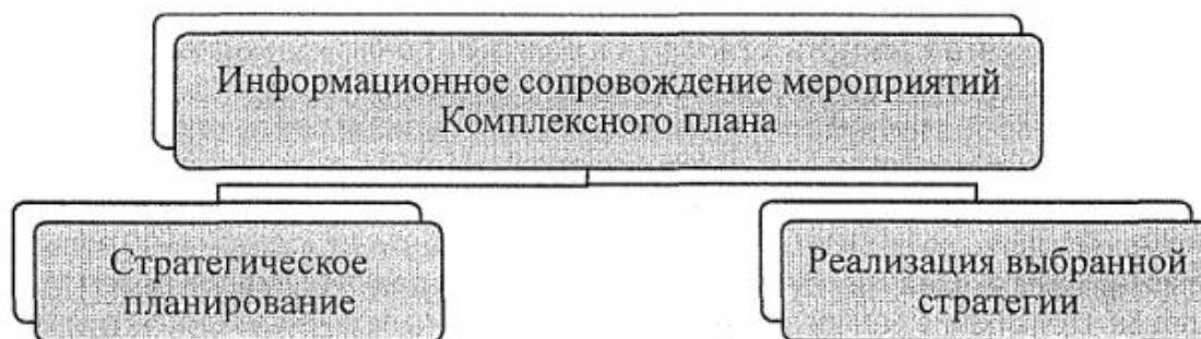
Рис.2. Планирование информационного сопровождения мероприятий Комплексного плана

Необходимость информационного сопровождения обусловлена растущей активностью радикальных группировок в информационном пространстве в целом. При этом антитеррористическая и антиэкстремистская деятельность остается неизвестной и непрозрачной для гражданского общества. Планирование информационного сопровождения предполагает два уровня (см. рис.2).